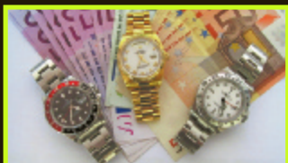
Ankauf von Uhren