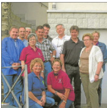
Vereinsvertreter des Organisationsteams der Ferienspiele Merenberg.

Die Plätze für die Ferienspiele sind teilweise vergeben, es sind jedoch noch einige Plätze in den verschiedenen Kursen frei. Anmeldungen für die Ferienspiele werden auch gerne von Kindern aus den Ortsteilen des Marktfleckens Merenberg entgegengenommen. Erkundigen Sie