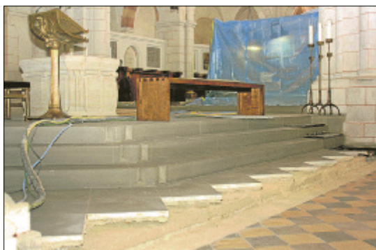
Am Altar im Dom wird gebaut. Der Boden wird unter einer Schutzfolie gereinigt (im Hintergrund). Zudem wird an der untersten Altarstufe gearbeitet.

-flu- LIMBURG. Viele Besucher, die den Limburger Dom voller Erwartung erhofft haben, sehen sich bald mit einem ungewöhnlichen Bild und Geräuschen konfrontiert, die so gar nicht in ein Gotteshaus passen.