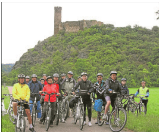
Auf dem Aartal-Rad- und Wanderweg am Fuße der Holzheimer Burg Aardeck starteten die Seniorinnen und Senioren auf ihren 35 Kilometer langen Rundkurs.

Um interessierte Seniorinnen und Senioren an den „Stromer“ heranzuführen und mit ihnen den sicheren Umgang zu üben, hatte die