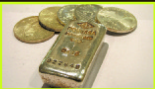
Gold- und Silberbarren