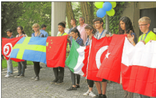
Das Foto zeigt einen Teil der Jugendlichen, die bei ihrer Begrüßung in Hadamar ihre Herkunft mit Landesfahnen dokumentierten.

flu-REGION. Der Lions-Club Limburg-Nassau hat am Sonntag auf dem Freigelände des Musischen Internats in Hadamar 17 Jugendliche zu einem Internationalen Camp im Nassauer Land begrüßt. Die jungen Leute im Alter zwischen 15 und 20 Jahren sind eigens dazu aus China, Polen, Weißrussland, aus der Türkei, Spanien, den USA, aus Schweden, Finnland, Tunesien und Italien angereist.