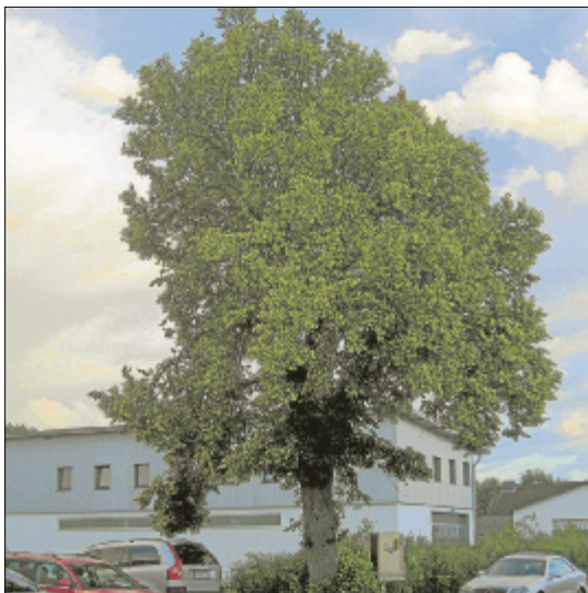
Muss diese stattliche Linde an der Mensfelder Straße wirklich einer Baustraße weichen?

Dass über den Todestag ausgerechnet einer stattlichen Linde, dem „Wappenbaum“ Lindenholzhausens, noch einmal nachgedacht wird, darf sich der Grünen-Stadtverordneten Leo Vancek auf die Fahne schreiben. Dem pensionierten Studienrat, der sich für die Erhaltung des Stadtgrüns einsetzt und in Limburg am liebsten eine Baumschutzsatzung durchsetzen würde, war der drohende Verlust dieser Linde im Rahmen des Bebauungsplans „Mensfelder Straße“ aufgestoßen. Mit dem Bebauungsplan soll ein Teilbereich des ehemaligen Sportplatzes zu Bauplatzen ausgewiesen werden und zwar um so genannten „beschlussunfähigen Verfahren“, in dem von einer Umweltprüfung abgesehen werden kann. Vancek will nicht akzeptieren, dass die stattliche, 25 bis 30 Meter hohe Linde mit einem Durchmesser von immerhin 50 Zentimetern, die zurzeit ihre voll Blüte entfaltet, dem Baugebiet im Wege steht. Die Stadt argumentiert, dass sich die Linde im Einmündungsbereich der geplanten Erschließungsstraße befindet und setzt sich im Rahmen der Abwägung über die Empfehlung der Unteren